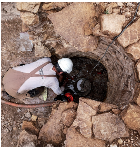
Puits en cours de fouille à Izernore