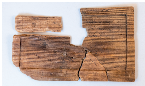
Tablette à écrire découverte dans l'un des puits

Les résultats de ses fouilles vous sont présentés de manière inédite dans une nouvelle exposition temporaire mêlant archéologie d'hier et d'aujourd'hui.